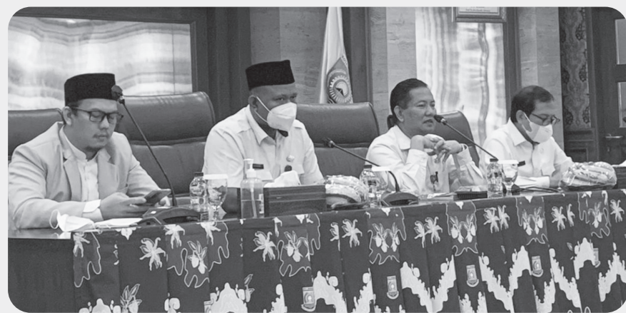
Rapat Koordinasi persiapan penyelenggaraan Festival Al Azhom di ruang Akhlaqul Karimah Gedung Puspem Kota Tangerang.

TANGERANG (IM) - Festival Al Azhom IX tahun 2022 akan dibuka Jumat 23 September dan berlangsung sampai 5 Oktober 2022. Perhelatan yang sempat vakum selama dua tahun lantaran diterpa pandemi covid 19, menjadi hajatan tahunan Pemerintah Kota Tangerang melalui Dinas Pemuda Olahraga yang selenggarakan Badan Komunikasi Pemuda Remaja Masjid (BKPRM) Kota Tangerang.