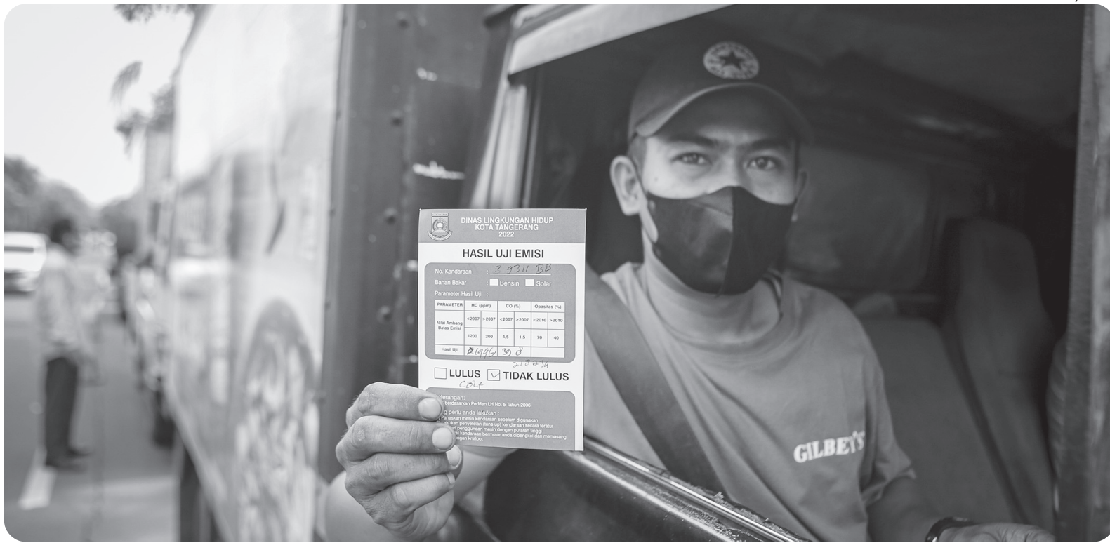
UJI EMISI GRATIS DI TANGERANG

Pengendara menunjukkan kartu hasil uji emisi usai mengikuti uji emisi gratis di Jalan Jendral Sudirman, Kota Tangerang, Banten, Rabu (21/9). Dinas Lingkungan Hidup Kota Tangerang menggelar uji emisi secara gratis bagi kendaraan roda empat dengan target 2.000 kendaraan.